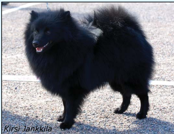
1. PMJV-12 DKJV-12 Damirazin Haaveiden Hurmuri, Mittelspitz, Om. Tarja Tastula, 60p