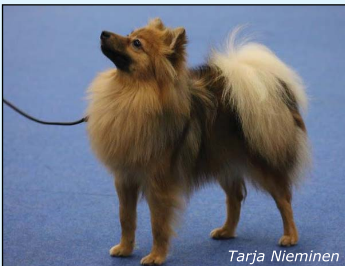
2. Darrenhoff Cutie Caramell, Mittelspitz, Om. Stina Hakala, 34p